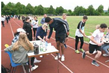
Jeder Meter zählt! – motiviert starten die Schülerinnen und Schüler in die Runden beim Sponsorenlauf.

Jeder Meter zählte und es kamen insgesamt 2000 Euro zusammen! Die erlaufene Summe sollte einer Organisation zugutekommen, die sich für die Menschen aus der Ukraine einsetzt und diese unterstützt. So entschieden sich die Verantwortlichen der SMV den Erlös an das Mehrgenerationenhaus Haßfurt zu spenden.