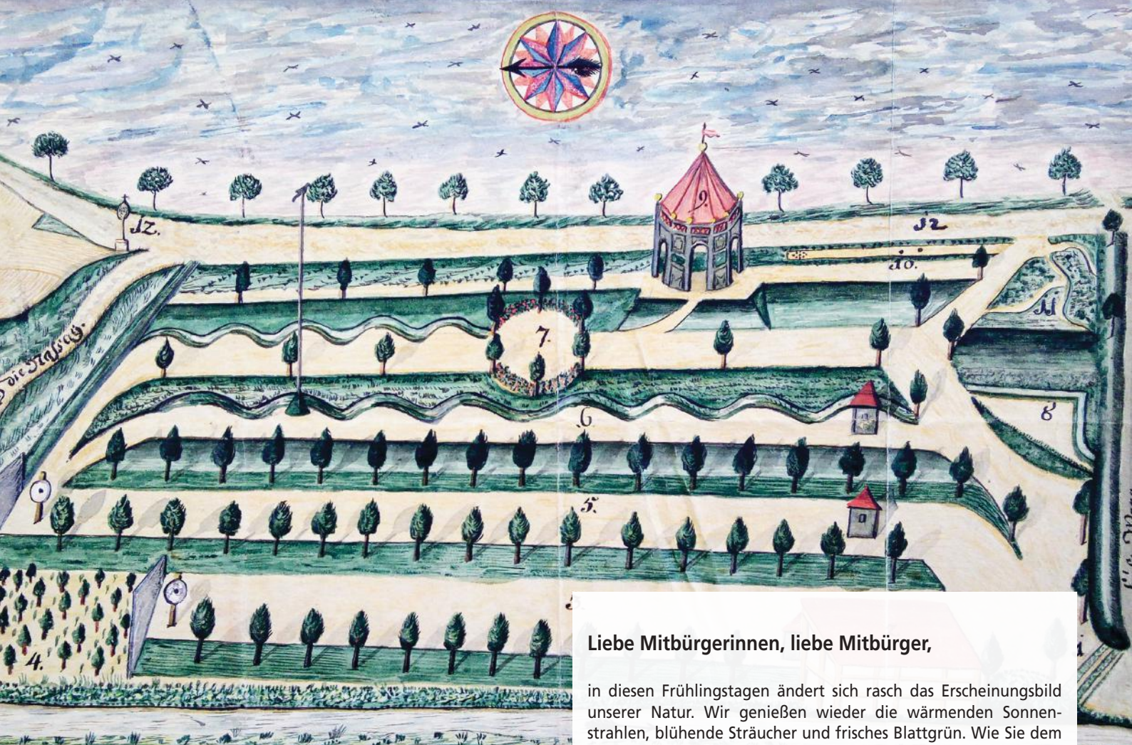
... des Schießplatzs in Stadt Haßfurt * Als No. 1. der E... ... langer Stand, 6. Bogelstand, 7. Spatziergang, 8. Kuhband, 9. C... ... Straße nach Sachsen: Haßfurt den 4 ten May 1811 ~