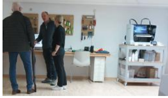
Der Erste und Dritte Bürgermeister informieren sich über den Stand zur Pegelmessung im Stadtlabor.

tenziellen Arbeitgebern zu knüpfen. Der Aktionskreis Haßfurt Aktiv (AHA) zeigte damit einmal mehr, dass sich die Stadt Haßfurt für eine erfolgreiche Zukunft der Region engagiert.