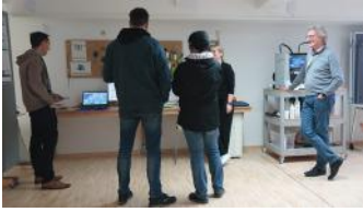
Das Team der Smart Green City Haßfurt stellt Interessierten auf der Zukunftsmesse die Sensorik zur Pegelmessung vor.