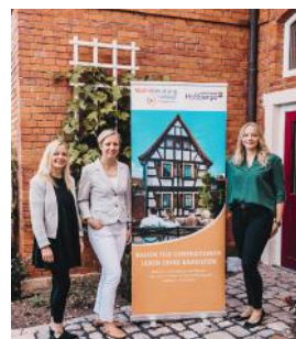
Gemeinsam mit der Wohnberatung des Landratsamtes Haßberge Barrieren abbauen.

Die Fachstelle für Wohnberatung des Landkreises Haßberge sucht engagierte Menschen aus allen Landkreisgemeinden, die als Ansprechpersonen in der ehrenamtlichen Wohnberatung tätig sein wollen. Die Ehrenamtlichen analysieren die bisherige Wohnsituation von Ratsuchenden und zeigen Möglichkeiten auf, wie die Wohnsituation verbessert werden kann. Zudem geben sie Informationen zu Förder- und Finanzierungsmöglichkeiten. Für die Beratungseinsätze wird eine Aufwandsentschädigung ausgezahlt.