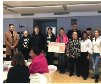
Schülerinnen und Schüler der Dr.-Auguste-Kirchner-Realschule Haßfurt übergeben die Spende aus dem Sponsorenlauf an das Mehrgenerationenhaus Haßfurt.

Sport verbindet die Menschen. Gerade in so schweren Zeiten wie den heutigen, ist es umso wichtiger, ein deutliches Zeichen für Frieden, Verbundenheit und Menschlichkeit zu setzen.