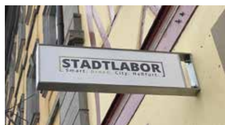
Jetzt auch von außen gut sichtbar - Das Stadtlaborschild in der Hauptstraße 7.

„Alles neu macht der Mai“! Für unser Stadtlabor gab es Anfang Mai das Hinweis-Schild, um auch von weitem in der Hauptstraße gut sichtbar zu sein. Schauen Sie gern einmal bei uns rein. Wir freuen uns auf Ihren Besuch und Ihre Unterstützung.